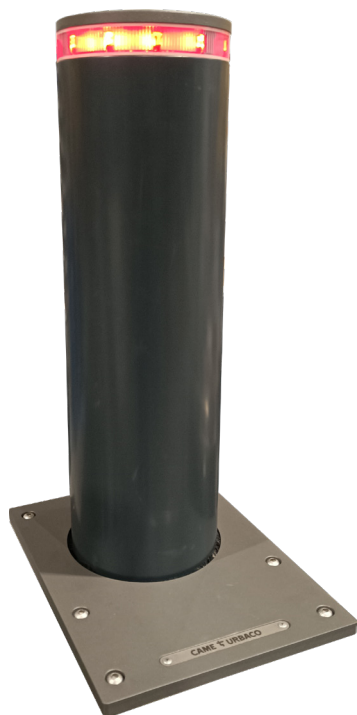
Vy ovan mark

URBACOs från Frankrike är en av Europas största tillverkare av pollare (fasta, demonterbara och automatiskt nedsänkbara). Tilverknigen startade 1984 och de första monterades i Sverige i slutet på 1990-talet.