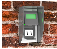
Scanner med regnskydd monterad på tegelvägg