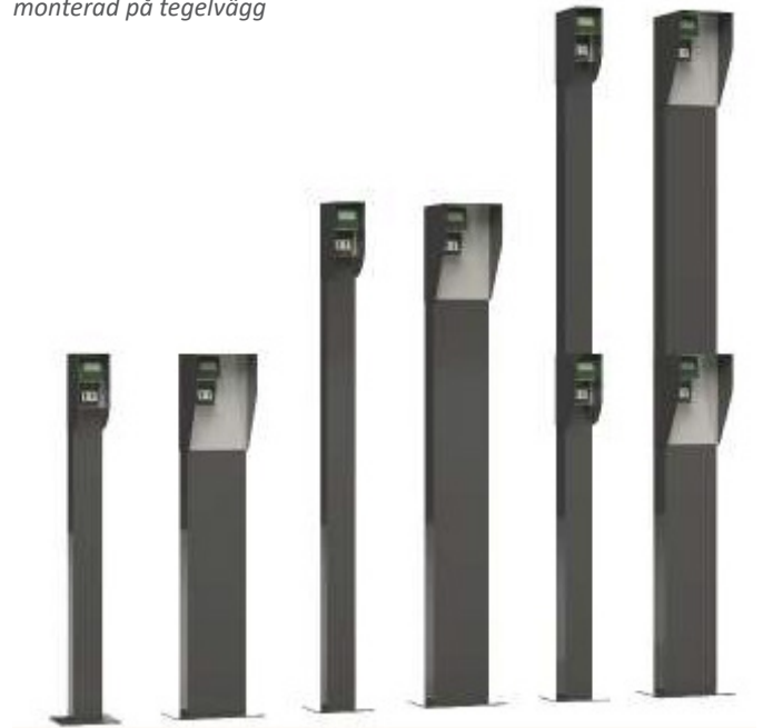
Pelare med regnskydd och monterad scanner.